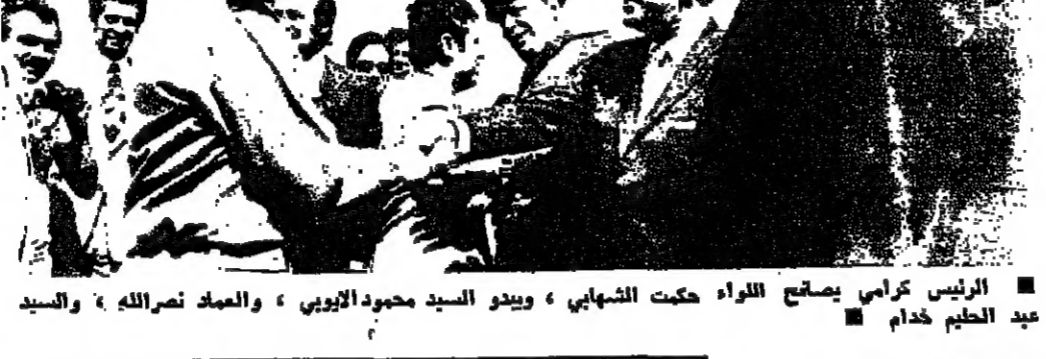
الرئيس كرامي يصافح اللواء حكمت الشهابي، ويبدو السيد محمود الأيوبي، والعماد نصرالله، والسيد عبد العظيم خدام